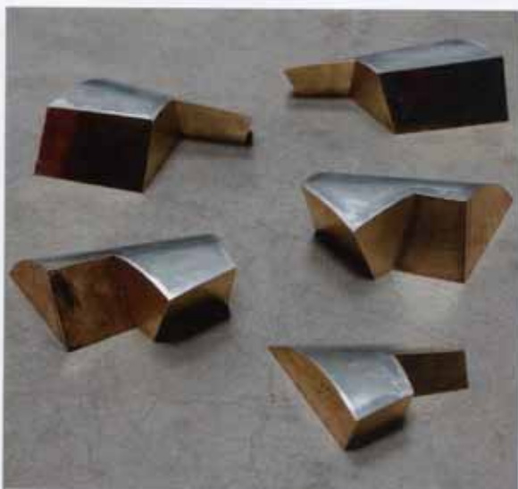
Shener in Assiet, 2016

"Ik ben zeven jaar werkzaam geweest als rehwisiteur bij de Nederlandse Operastichting. Daar heb ik veel kennis over materialen opgedaan. Daarna ging ik naar de Rijksveld Academie. Daar ben ik begonnen als schilder, maar koos ik uiteindelijk voor monumentale vormgeving. In die periode raakte ik geïnteresseerd in lijsten om schilderijen. Ik heb de vormen en profielen daarvan bestudeerd. Die ben ik zelfstandig gaan gebruiken en ik heb er ma-