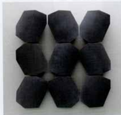
Kavel25, zink, 100 x 100 x 12,5 cm, 2018

quettes van zink gemaakt. Die interesse werd steeds groter en na verloop van tijd werden het werken die ik zelfstandig kon exposeren."