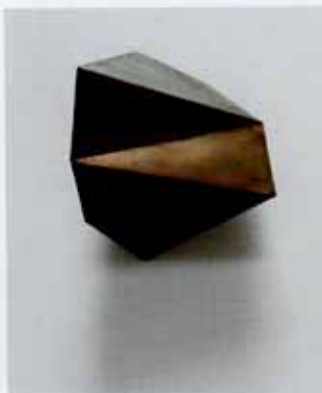
Dancing Cube 4, zink en messing, 22 x 22 x 15 cm, 2015

Meerdere objecten worden aan de muur gehangen. Hij berekent precies waar ze moeten komen en hoe ze zich ten opzichte van elkaar moeten verhouden om de tussenruimtes erbij te bekijken.