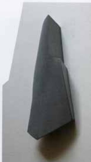
Eef, Gevelend Land (Joh Beemster), Museum Waterland, 2004 · Gemeente Wierde, zink, 52 x 26 x 11 cm., 2008

Om het geheel strak van vorm te houden heeft hij een ingenieus systeem bedacht, berustend op het construeren van een frame van spijlen. Het zijn gegalvaniseerde stalen staafjes die voorkomen dat de gelaste verbindingen gaan wijken.