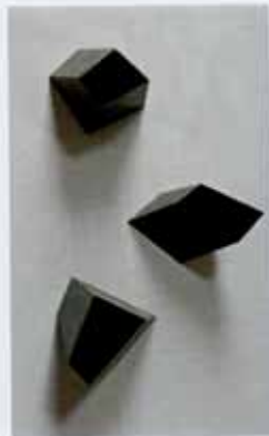
Berlijn 4, zink en messing, 2015